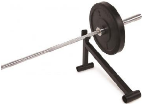
550844 SOPORTE CAMBIO DISCOS