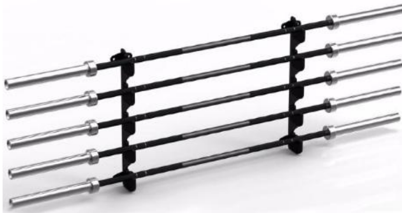
550842 SOPORTE BARRAS OLIMPICAS SUELO

Ahorra espacio. Fabricada en acero de gran resistencia. Con soportes acabados en plástico para no dañar las barras.