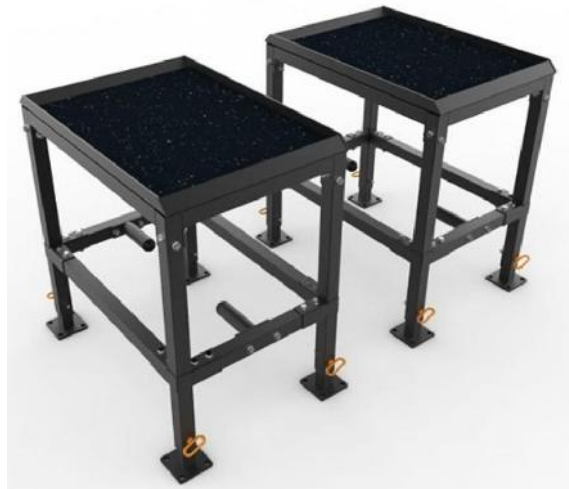
550849 JERK BOXES AJUSTABLE